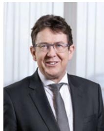
Albert Rösti Bundesrat