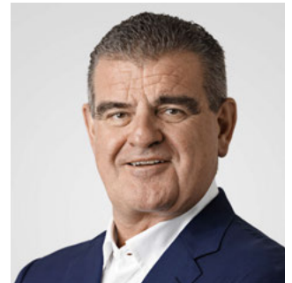
Peter Spuhler Verwaltungsratspräsident Stadler Rail AG